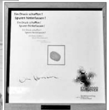
SPUREN: Schauspieler Dennis Hopper hinterließ seinen Daumenabdruck.